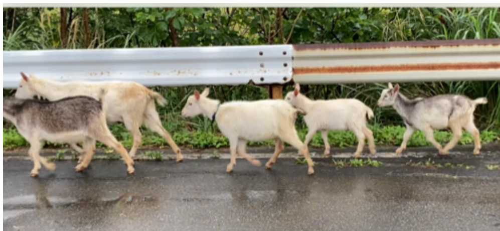
2023 年 1 月 久部良から比川にむかう県道 216 号にて

北樹出版の『初学者のための憲法学』では、おそらく憲法の教科書としては初めてだと思いますが、与那国島のことを書きました。与那国島は自然豊かで良いところですが、私が与那国島に行ったのは「観光」のためでなく、軍事基地化が進む「与那国」の実態を把握し、その問題点を社会に提起するためです。2022 年 12 月 16 日、岸田自公政権は「国家安全保障戦略」、「国家防衛戦略」、「防衛力整備計画」の安保 3 文書を閣議決定しました。本稿はいままでの与那国島での調査に基づき、2022 年の安保 3 文書が与那国にどのような影響を及ぼすかを紹介します。