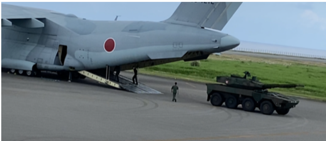
美保基地 C-2 から降車する、北熊本駐屯地の MCV。2022 年 11 月 17 日飯島撮影

対処力の強化の一環として、日頃から、双方の施設等の共同使用の増加、訓練等を通じた日米の部隊の双方の施設等への展開等を進める」とされています。安保3文書で明記されたように、与那国島での日米共同訓練も増加する可能性があります。