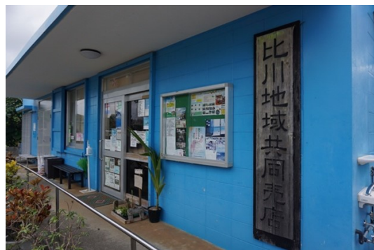
比川地域共同売店の入口

与那国島で継承され再構成されてきた伝統文化と、人びとの生活が交わる場として機能しているのが比川地域共同売店である。「共同売店」はこれまで沖縄の地域社会のありようを象徴する存在として社会学などで注目され、研究が蓄積されてきた。沖縄本島最北部の国頭村奥集落で1906年につくられたのが最初とされる。それは近代化に際し沖縄・奄美の村落共同体が主体となつてつくった「売店」であるが、商品を販売するだけにとどまらず、村の産品を集約して