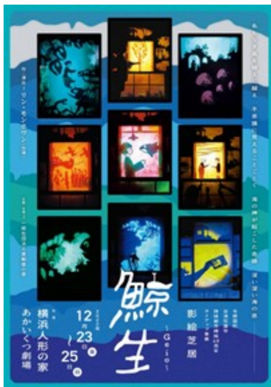
「鯨生」：与那国町と台湾花蓮市のタイアップによる影絵芝居