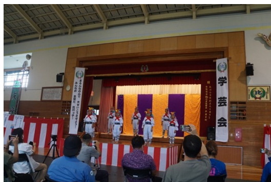
比川小学校の学芸会

芸能は地域社会で代々継承されているだけでなく、現代的に刷新され対外発信も盛んに行われている。音楽分野では、民謡が洗練された編成のCDとなって販売されたりインターネットで配信されたりしているほか、折からのエスニック音楽ブームに乗り、島のミュージシャンが内地や