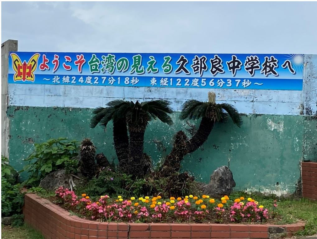
久部良中学校。2022年8月飯島撮影

きです。人的交流・経済的結びつきを強化するという点では、2005年3月に策定された、「与那国・自立へのビジョン 自立・自治・共生 ～アジアと結ぶ国境の島 YONAGUNI」の構想の実現は極めて重要です。与那国町のHPで入手可能ですので詳しくはそちらをご覧くださいですが、与那国が台湾や中国、沖縄や日本との人的・経済的交流の中継点となることで、EUやASEANのように戦争できない関係を生み出すことができると同時に、与那国の経済の活性化にもつながる可能性があります。安保3文書のように、中国などを敵視してミサイル部隊などを与那国に配備するのではなく、EUやASEANを手本として、そして「与那国・自立へのビジョン」のように近隣諸国との信頼醸成を求めている外交手段を追及することこそ、与那国の市民の平和と安全、そして地域経済の活性化につながります。