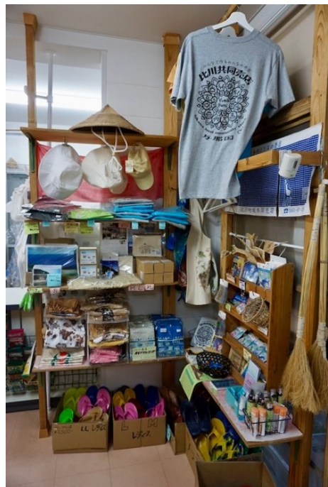
入口横におかれた島産品

店舗中央にある 3 列の商品棚のうち前の 2 列は食品が並べられており、地場の産品と、コンビニエンスストアやスーパーにありそうな量販品が混在してい