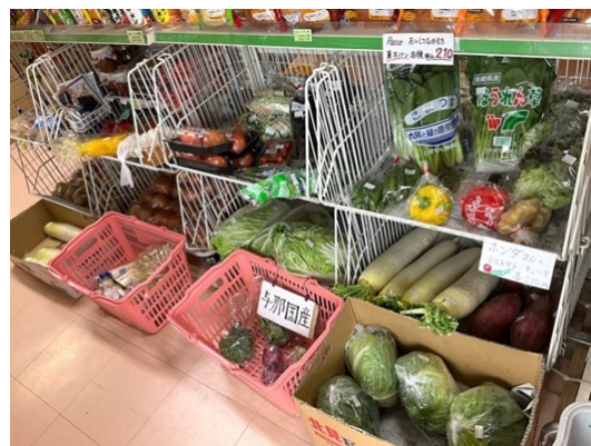
島野菜にはタグがつけられている

「消費者目線」もまた際立っている。最奥の棚とその向こうの壁際は雑貨類が並び、とりわけ少量多品種が徹底されているが、これは消費する側の立場に立った仕入れの結果でもある。すなわち、地域の常連客の多くは自分が買いたい品を見つけられないと店員にリクエストし、店員はそれをノートに記載し次の回に発注する。その際その客の分だけでなく、いくつか多めに注文し店頭と並べる。それが繰り返されることで棚に多種多様な品が並ぶことになる。ただし状況に応じて発注する傾向があるため、仕入れの全体像が見えづらいという難点もあるという。また地産地消を理想としているものの、消費者の立場に立つと価格の安い店（大手インターネット通販）への依存が高くなってしまふこと、なかでも大手 A 社はまとめ買いをすると配送料が無料になるためつい利用してしまうのがジレンマであるという。離島のハンディキャップを帳消しにしてくれるのがグローバル企業であるというのは皮肉だと、A さんは苦笑いする。