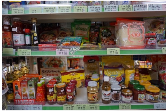
棚の奥には別の商品が

比川地域共同売店はどのような店かと問われれば、一見するとコンビニエンスストアに似ているが、しかしよく見ると大きく異なる点も多い店、と答えられるだろう。年中無休で営業時間は 8:00～20:00、店内は蛍光灯が煌々と光り、鄙びた小集落には似つかわしくないほど明るい。店舗の床面積は一般的なコンビニエンスストアの 2/3 程度で、どの棚にも商品が所狭しとぎっしり並び、壁や床にも種々の品があふれる。入口横の窓際には地域の産品や土産物、1 列目の