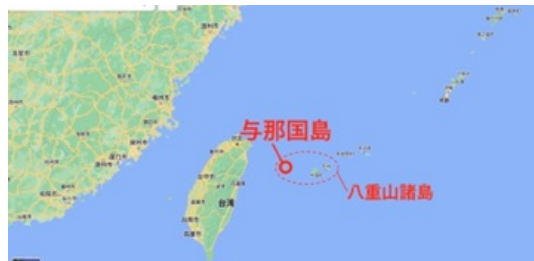
与那国島を中心に置いた地図：googlemapをもとに作成

与那国島は日本の西端に位置する離島である。この地理的な環境は本稿のテーマを考えるうえで重要であるので、やや立ち入って紹介したい。この島は沖縄本島の南西にある八重山諸島のうち最も西に位置し、最も近い西表島まで64km、八重山諸島の中心地である石垣島まで127kmある。沖縄本島までは509kmもあるが、これは東京と大阪の距離におよそ等しい。島の周囲は