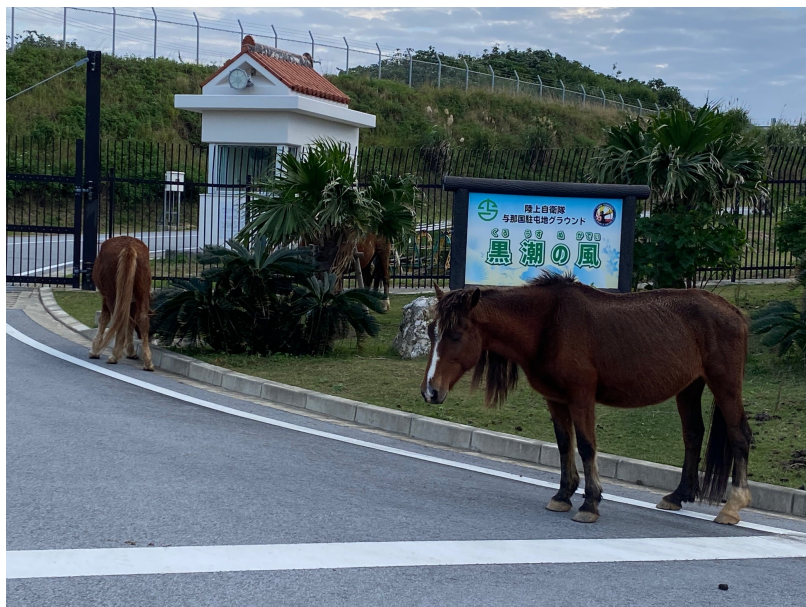
与那国馬と与那国駐屯地グラウンド。2023年1月

さらに与那国島での自衛隊配備・強化について防衛省は「説明責任」を果たしていません。「国家防衛戦略」13ページでは「地元に対する説明責任を果たしながら、地元の要望や情勢に応じた調整を実施する」とされています。しかし2023年3月段階でも、与那国の市民が求めているミサイル配備について防衛省の説明会は開催されていません。