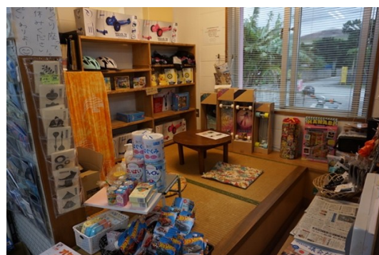
ゆんたく座敷

1日のあいだの来客傾向はどうだろうか。平日の朝は通勤途中の男性らが慌ただしく朝食を買っていき、日中は比川のお年寄りらが食品や雑貨を買いがてら店員とおしゃべりする姿がみられ、1日に何度も来店する人もいる。また時折、地域の個人や業者が惣菜や地場産品などの納入にやってきましたり、観光客が大勢やってきて土産物や飲物を買っていくこともある。夕方には帰宅前の女性らが食品を購入していく。休日には家族連れが賑やかに菓子や玩具をみにくる。来客が多いのは通勤時間帯の朝夕だが、それ以外の時間帯も誰かしら客が店内にいる時間はかなり多い。