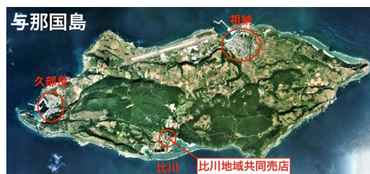
与那国島の3集落と売店：国土地理院の地図・空中写真閲覧サービスをもとに作成

荒れがちな海に囲まれた与那国島での生活は、長らく島内における自給自足を柱に近隣の八重山諸島や台湾との関係のうえに成り立ってきた。その歴史のなかでもとりわけ活況を呈したといえるのが、明治期から大正期にかけて、そして戦後の数年間における、人口の顕著な増加期である。前者は主に自然増であるが、後者は香港・台湾との関係を深め密貿易で栄えたことによる社会増である。戦後の最盛期の人口は公式な記録に残るだけでも6,300人を超え、一時在島者を合わせると15,000人を超えていたともいわれる。しかしその後、台湾との国境の管理が厳格化すると一転して人口が減少しはじめ、現在に至るまでその傾向が継続している。すなわちまず石垣島や沖縄本島への流出に伴う急激な社会減が起き、その後ゆるやかな自然減が継続している(小野雅司ほか 1979:99-103)。