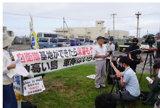
戦闘車公道走行への抗議

私が与那国島を初めて訪れたのは2022年11月、自衛隊の戦闘車による公道走行が初めて実施される前日、冷たい雨と重苦しい空気が島を覆う暮れ方だった。翌日、空港前で行われた抗議活動に参加したが、声をあげる人たちの少なさと、彼らの姿を追いその声をしきりに拾おうとするたくさんのカメラやマイクのアンバランスが、この島における自衛隊反対運動のおかれた厳しい状況を見せつけていた。国家の巨大な力が国境の小さな島を覆い尽くそうとしているようにみえた。前日に初めてやってきたに過ぎない私が、メディアや地元のさまざまな目に晒されつつそれでも声をあげている人びとと同じように声をあげるのは憚られ、急遽つくってもらったプラカードを手に黙って道に立ち続けた。